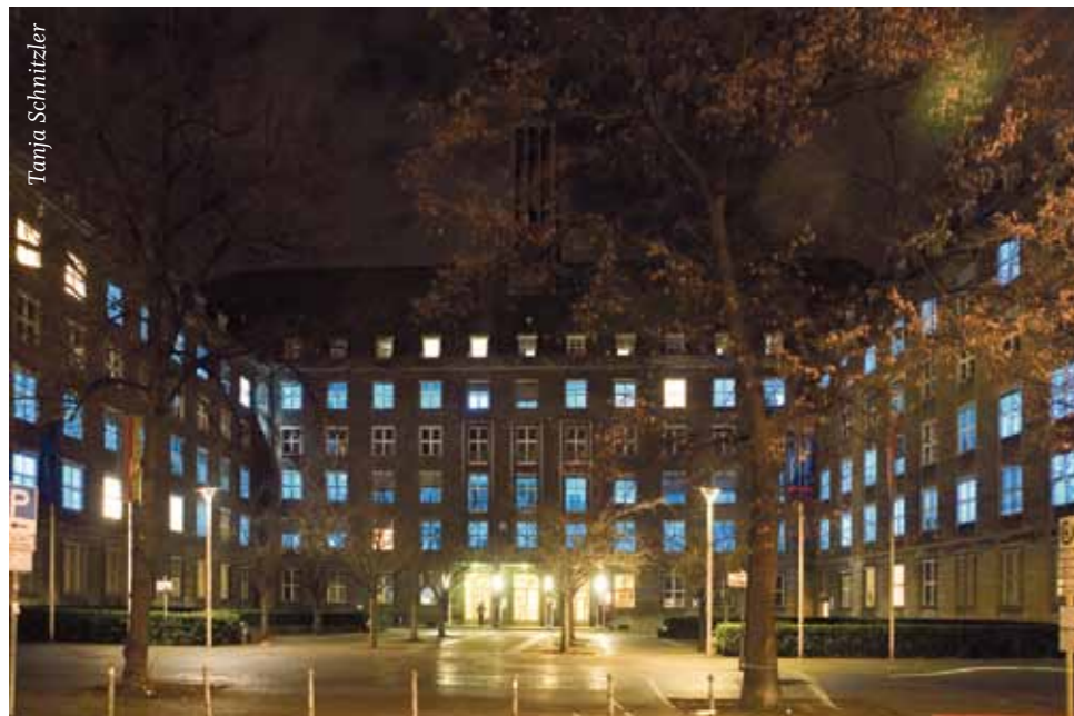
Vom 19. November bis 1. Dezember boten das Moabiter Rathaus und das Brüder-Grimm-Haus in der Turmstraße einen ungewöhnlichen Anblick: Die Fenster waren unterschiedlich illuminiert; die Lichtinstallation hatte der Künstler Kamil Rohde gestaltet. Organisiert wurde die Aktion vom Geschäftsstraßenmanagement Turmstraße, um in Moabit mehr Licht in der dunklen Jahreszeit zu schaffen. Auch die Zunfthalle beteiligte sich, allerdings mit einer eigenen Aktion. (siehe S. 10).